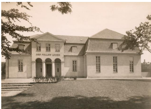
Nonnebakken 1, som bygningen så ud ved indvielsen i 1934