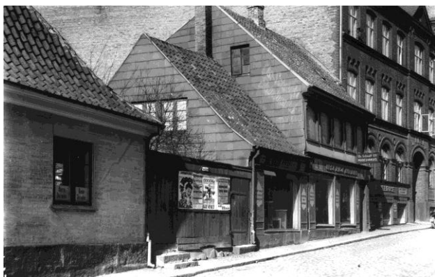
Logebygningen i 1924 set fra Munkemøllestræde med porten.