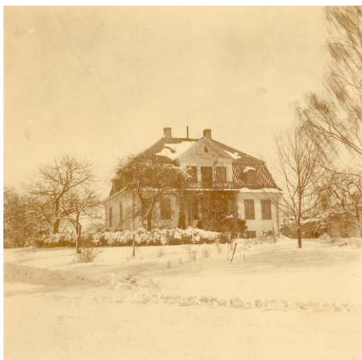
Landstedet på Nonnebjerg, vinteren 1900 efter udvidelsen