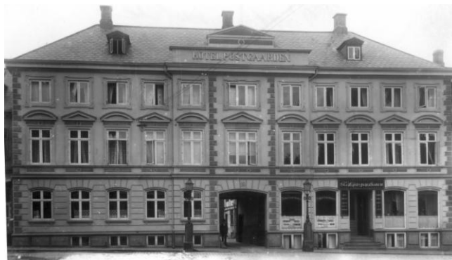
Hotel Postgården 1925