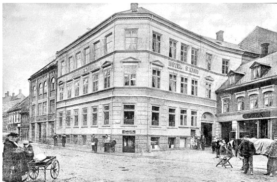
Hotel Sct. Knud 1900