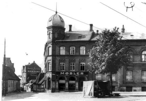
Logebygningen i 1932 set fra Klingenberg med det karakteristiske tårn