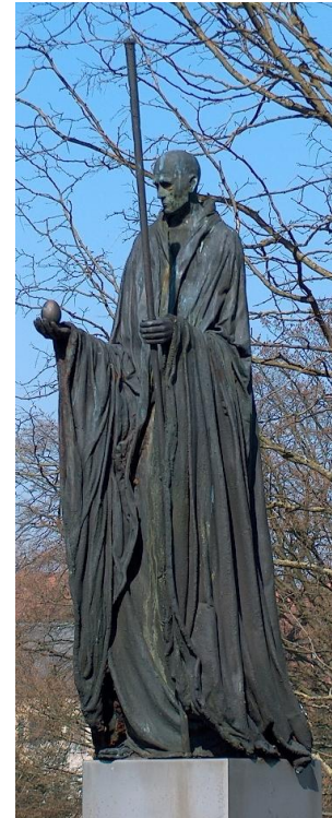
Samaritaneren (J. Galschiøt)

Køkkenet , der fra starten var placeret i kælderen under festsalene, blev med årene mere og mere utidssvarende og al den frisklavede mad skulle hæves op med en lille og langsom madelevator. Det blev derfor i 2012 besluttet at tilbygge et nyt køkken i den sydvestlige del af bygningen, ind mod ejendommen Hunderupvej 22 som er ejet af et legat under broderloge nr. 36 Treuga Dei I.O.O.F. For at få et sådant byggeri til at hænge sammen rent økonomisk, blev det arrangeret således at, Odd Fellow Palæets Administrations Udvalg blev lejer af Hunderupvej 22. Her blev der indrettet to kontorlejligheder der blev fremlejet, samt en ala carte restaurant, "Palæet" som indgik i aftalen med restauratøren, sammen med forpagtningen af Odd Fellow Palæets køkken og selskabslokaler.