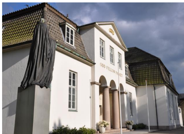
Samme bygning i 2015 med et glimt af det nye køkken til højre