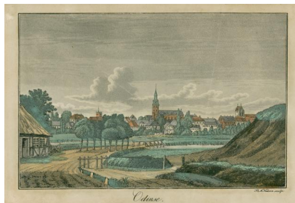
Farvelagt kobberstik fra ca. 1830. Udsigt mod byen fra Nonnebakken.

Allerede i anden halvdel af dette århundrede, år 1175, blev der bygget et nonnekloster og omkring år 1200, var navnet blevet ændret til 'Nonneburg'. På det tidspunkt var benediktinernonnerne dog allerede flyttet videre, ud til Dalum Kloster, hvor de fungerede frem til reformationen, hvor kongen overtog bygningerne. Mange år senere i 1906 blev det nuværende Dalum Kloster, overtaget af Skt. Hedvigsordenen. 'Nonneburg' ændrede, i middelalderen navn til 'Nonnebjerg' og siden til 'Nonnebakken'. Vikingeborgen var glemt, men nonnerne blev husket!