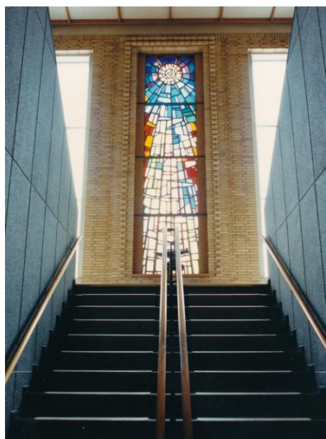
Her ses trappen op til 1. sal med glasmosaikken og ambolten

Odd Fellow Palæet Nonnebakken rummer to etager plus kælder og loftsrum. I stueetagen er der festlokaler og på førstesalen findes to logesale. Herudover er der mange værelser der anvendes til forskellige formål, men lad os, tage en tur rundt i huset. Uanset om man går ind af hovedindgang eller bagindgangen fra parkeringspladsen, havner man i trapperummet. På vej op af trappen bemærkes den smukke glasmosaik, hvor lysets stråler skinner en i møde, når man bevæger sig opad. Mosaikken er fremstillet af kunstneren C. A. Nielsen i 1934.