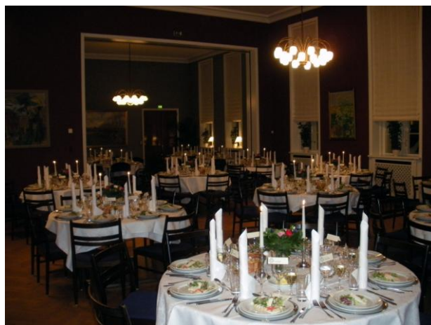
Det sidste kontrolleres før den store festsal er klar til stiftelsesfest. Der er dækket op til 184 deltagere ved de runde borde.

I den Lille Festsal kan der dækkes op til 72 spisende gæster og i den Store Festsal kan der, hvis sænkeporten mellem festsal og læderstue køres i bund, dækkes op til ca. 216 spisende gæster og ved runde otte-mands borde til 184. Scenen er forsynet med et fornemt Bechstein koncertflygel skænket af broderloge nr. 36 Treuga Dei I.O.O.F, og alle de skønne malerier på væggen i alle stueetagens rum, er modtaget som gaver eller er blevet indkøbt af, og vedligeholdes nu af Nonnebakkens Kunstforening. Kunstværkerne er på nær et, malet af fynske kunstnere. For øvrigt er den Store Festsal indviet som logesal, og den kan således anvendes til afholdelse af festloge med mange deltagere. Den har dog ikke været anvendt til dette formål i mange år.