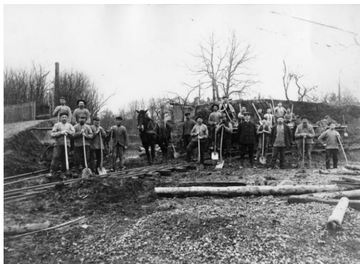
Ansatte hos Hans Jørgensen & søn i gang med at fjerne resterne af ringvolden